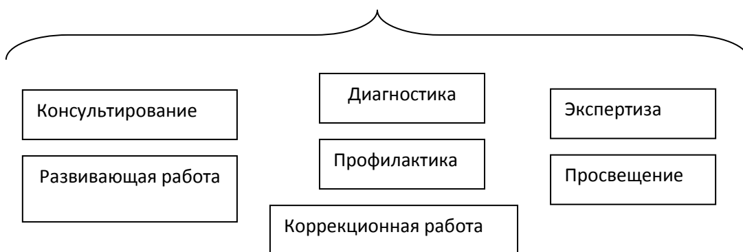
Основные направления психолого-педагогического сопровождения